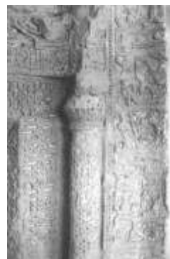
تصویر ۶ ب. جزئیات کتیبه باند دومین محراب (Anisi, 2004).