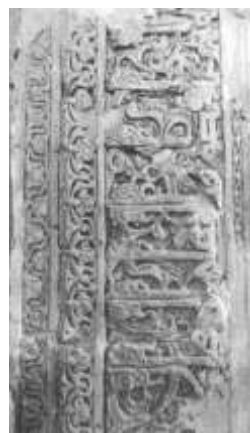
تصویر ۵ ب - تزئینات کتیبه کوفی بر قوس اولین محراب شبستان امام حسن (Anisi, 2004).

دومین تورفتگی مستطیل‌شکل دوازده سانتی‌متر عمق دارد که داخل تورفتگی اصلی واقع شده و دربردارنده دو قوس کور به همراه دو ستون کوتاه گرد است. در حاشیه داخلی محراب، تزئیناتی به شکل کتیبه کوفی گره‌دار به چشم می‌خورد که در داخل قاب بالای تورفتگی مستطیلی قرار گرفته و پایه‌ای برای قسمت میانی قوس اصلی به شمار می‌آید (تصویر ۶ ب). محراب سوم، ۲/۱۳ متر عرض و ۲/۲۵ متر ارتفاع دارد که مرکز آن، به وسیله قوس فرورفته‌ای پُر شده است. دو ستون پیش‌آمده با سرستون مدور و با تزئینات گیاهی، پهلو و جناح تورفتگی محراب را تزئین کرده‌اند (تصویر ۷ الف). به علاوه کتیبه‌ای کوفی در پس‌زمینه داخلی محراب نگاشته شده و گچبری‌هایی در الگوی اسلیمی قسمت میانی قوس تورفته محراب را تزئین کرده است. الگوی مشابه چنین گچبری‌هایی در مسجد جامع اردستان (۵۵۵ ق/۱۱۶۰ م) و در مقبره پیر حمزه سبزی‌پوش در ابرکوه (۵۱۰ ق/۱۱۱۶ م) مشاهده می‌شود. بر حاشیه محراب، آیه «اقم الصلوه للذکر الشمس الی غسق اللیل» تا آخر آیه ۷۹ سوره بنی اسرائیل به خط کوفی مشجّر در زمینه نقوش اسلیمی حک شده است. بر حاشیه تاق‌نمای وسط محراب، کتیبه‌ای به