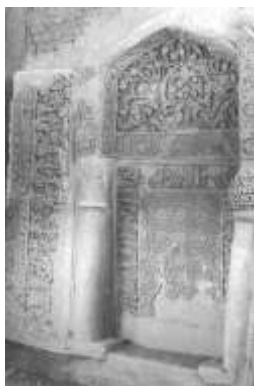
تصویر ۷ ب - جزئیات کتیبه باند سومین محراب واقع بر بالای شبستان امام حسن (Anisi, 2004).