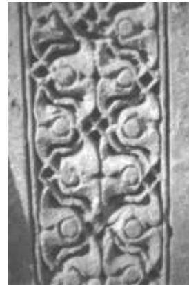
تصویر ۴ - نقش‌مایه‌های گیاهی واقع در نوار بیرونی محراب شبستان امام حسن (Anisi, 2004).

اولین محراب ۲/۲۲ متر عرض و ۲/۵ متر ارتفاع دارد و شامل یک تورفتگی مرکزی در داخل قاب مستطیلی باریکی است که با کتیبه‌هایی تزئین شده است (تصویر ۵ الف). تورفتگی این محراب هفده سانتی‌متر عمق دارد و قوس آن، بر پایه‌ی دو ستون پیش‌افکنده بنا شده که با شبکه‌ای از تزئینات ستاره‌ای شکل تزئین شده‌اند و سرستون آنها، دارای تزئینات چندوجهی است. بقایایی از گچبری کتیبه کوفی به شکل برجسته‌ای در قسمت میانی قوس این محراب مشاهده می‌شود. تزئینات اسلیمی فضای میانی کلمات را پُر کرده و قابی از الگوهای هندسی، با دوایر و لوزی‌هایی که در زیر قسمت میانی قوس محراب واقع شده‌اند، هم‌پوشانی پیدا کرده است. هم‌چنین نواری با کتیبه کوفی در بخش بیرونی قسمت تورفته‌ی قوس اجرا شده است.