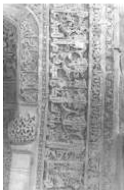
تصویر ۷ الف - نمای عمومی سومین محراب واقع بر بالای شبستان امام حسن (Anisi, 2004).