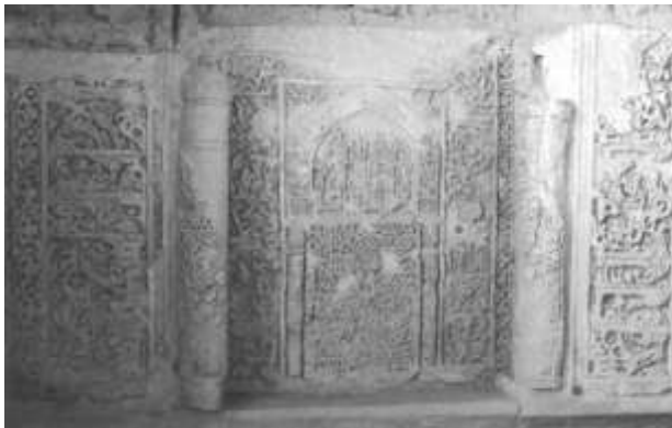
تصویر ۵ الف - نمای عمومی اولین محراب بر بالای سقف شبستان امام حسن (Anisi, 2004).

بر بالای شبستان امام حسن، و در واقع، بر روی بام کنونی مسجد و در کنار گنبدخانه‌ی ایوان اصلی، سه محراب گچبری شده وجود دارد که محراب میانی، محراب اصلی بوده است و دو محراب دیگر که جنبه‌ی تزئیناتی داشته‌اند بازوهای این محراب محسوب می‌شوند. از شواهد امر و به‌خصوص وجود این محراب‌ها برمی‌آید که در این مسجد در دو طبقه نماز برگزار می‌شده است. نکته‌ی قابل توجه در رابطه با این محراب‌ها این است که دقیقاً بر روی محراب شبستان امام حسن واقع شده‌اند، با این تفاوت که محراب‌های روی بام حدود ۱/۵ متر در مقطع عقب‌تر از محراب طبقه‌ی پائین واقع شده‌اند (منوچهری، ۱۳۷۹: ۱۳۷).