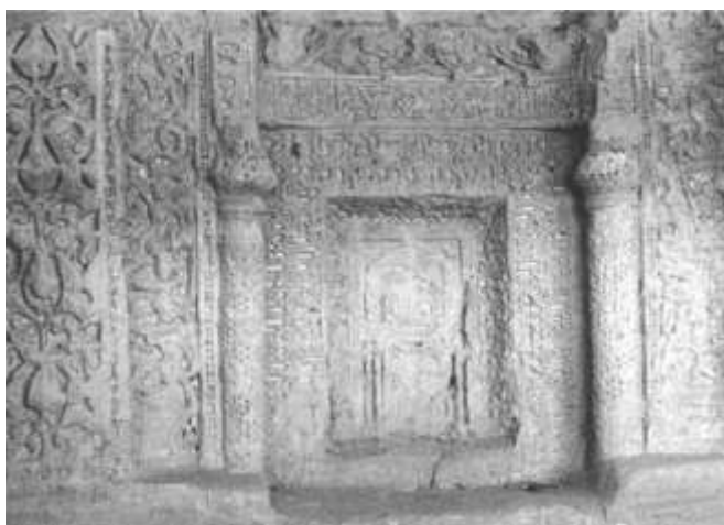
تصویر ۶ الف - نمای عمومی دومین محراب واقع در بالای شبستان امام حسین

محراب دوم در موقعیت مرکزی‌تری نسبت به دو محراب دیگر قرار دارد و دارای ۲/۴۱ متر عرض و ۲/۴۰ متر ارتفاع است که قسمت بالای آن از بین رفته است (تصویر ۶ الف). بقایای دو ستون پیش‌آمده و تزئیناتی با نقوش برجسته در مرکز قوس محراب به چشم می‌خورد.